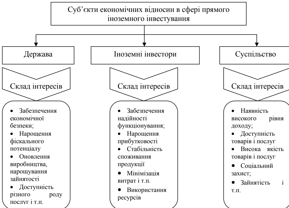
Рис. 1 Система інтересів представників транснаціоналізації економічної діяльності.

Фінансова політика більшості ТНК в сфері мінімізації витрат, зводиться до нерационального використання місцевих ресурсів або «ігноруванням витрат» щодо фінансування заходів на вторинне відтворення використаних ресурсів.